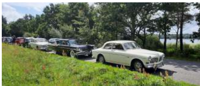
Pause ved Madum Sø.

Efter en halv times pause fortsatte turen mod Hellum, Asp, Skørping og tilbage til Rebild, hvor vi fik parkeret bilerne, inden vi gik mod Westernhuset, hvor der var dækket op til kaffe/te og æblekage.