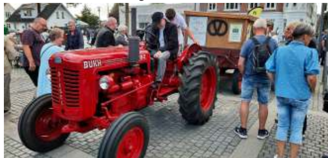
Ca. kl. 20 kom Nørregades bageri med varme rundstykker i deres lille røde Bukh traktor.

På grund af det gode vejr, blev der rigtig hyggesnakket imens man spiste, og folk blev siddende længe og hyggede sig med en øl eller sodavand. Der var også rigtig mange, der gik rundt og kiggede på alle køretøjerne, så hele hovedgaden vrimgledede med glade folk, der rigtig hyggede sig. Mange havde også fundet vej ned i centret, hvor der var gode tilbud hele aftenen.