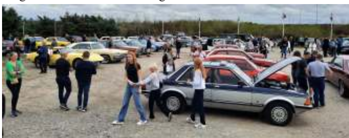
Pæn tilslutning til træffet med 50-60 biler.

Herefter kørte vi tilbage og fik parkeret vores biler på pladsen foran campingpladsen, og kort efter begyndte der at komme flere biler. Der kom også en "food truck", hvor man kunne købe burgere. Der var fin tilslutning til træffet med 50-60 biler.