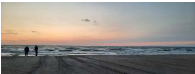
Efter aftensmaden var der nogle stykker, der gik en tur til vandet.

Efter kaffen blev teltet sat op, så det var klar til, at vi kunne sidde i det, når der skulle grilles til aften. Om aftenen hyggede vi os i teltet med kaffe og kage.