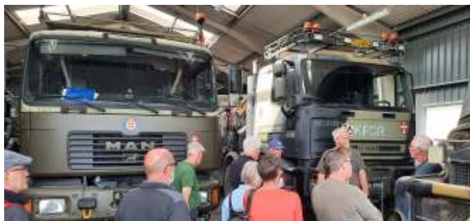
Et par af de lastbiler, som foreningen har.

Da vi havde kigget lidt blev Centurionen bakket ind i garagen igen, og vi kørte over til en anden hal, hvor de havde forskellige lastbiler, som vi også skulle se.