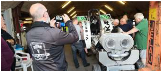
Formanden filmer opstarten af Ivecoen.

De mange forskellige motorcykler er parkeret i gården hos "Team Hvilsom". Vi ankom til "Team Hvilsom", hvor vi skulle sparke dæk på deres Iveco traktor, og se hvad de gik og hyggede sig med. Så det var en flok drenge og piger, der blev sluppet løs i slikbutikken. Det var spændende at se og høre om, og det var hele familien, der var med, når de tog til traktortræk rundt omkring i landet/udlandet. Efter et stykke tid var det tid til kaffe og kage. Hold da helt op, der var KAGE. Efter kaffen og kagen skulle vi lige høre Ivecoen starte op, og så lyste alle de små drenges ansigter op i store smil.