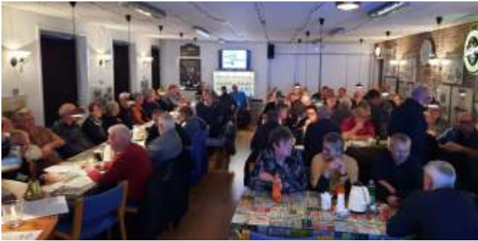
Flot fremmøde til generalforsamlingen.