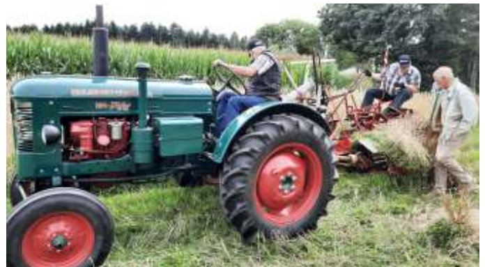
Høst med en Bolinder-Munktell.

Efter køreturen gik vi i marken for at se på høsten med de gamle maskiner. Der var desværre ikke lige så meget aktivitet, som sidste år, men der blev da høstet med et par maskiner.