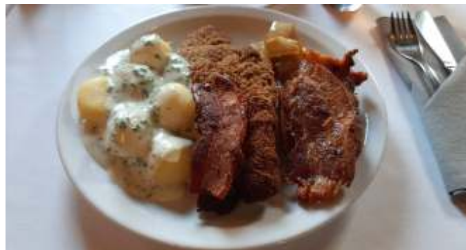
Der var 3 forskellige slags flæsk.

Herefter var der nogle, der kørte direkte tilbage til campingpladsen, men vi var 7 biler, der kørte en tur ned til havnen. Nogle snakkede om at tage færgen til Norge, men de opgav det, da de jo ikke havde billetter. Herefter kørte vi tilbage til campingpladsen, hvor vi fik kaffe. Vi skulle traditionen tro til Biersted Kro, og have stegt flæsk med kartofler og persillesovs til aften. Kroen har fået ny ejer, og han var ved at lave nyt køkken, så han havde egentlig lukket, men da han fik at vide, at vi var kommet der gennem mange år, valgte han at holde specielt åben kun for os. Det var lidt specielt at vi kun var Aalestrup Classic folk på kroen, men da vi var omkring 35 personer, så føltes det ikke så tomt endda. De havde også lavet om på serveringen, således at det, for at undgå madspild, fremover er buffet, hvor man selv henter maden. Før kom der store fade rundt med flæsk, og havde et fad været rundt ved et bord, kunne de jo ikke sende det ud til at andet bord, selvom der ikke var taget ret meget fra fadet.