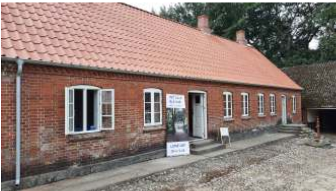
Hougaarden med det nye tag.

Vi sad og snakkede lidt ved bilerne inden vi gik ud for at se på aktiviteterne. Som noget nyt var der åbent i Hougaarden, som er byens ældste gård. Foreningen bag levende landsby overtog den for et par år siden, og der er i løbet af det sidste år blevet lavet rigtig meget ved bygningen, hvor blandt andet hele tagkonstruktionen er udskiftet. Der mangler stadig at blive gjort meget, men de er godt på vej.