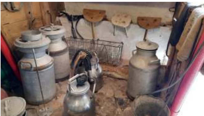
Gamle maskiner til køling af mælk.

I staldbygningerne var der udstillet flere gamle maskiner til malkning og køling af mælk, samt masser af gamle redskaber.