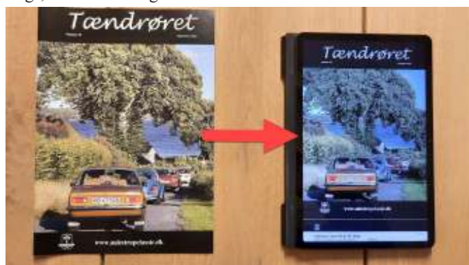
Klubbladet overgår snart fra et rigtigt klubblad i papir til et digitalt klubblad.

Der er naturligvis både ulemper og fordele i et digitalt klubblad. Vi har tænkt nogle af dem, og der er sikkert mange flere af begge slags, men her er nogle det kunne være.