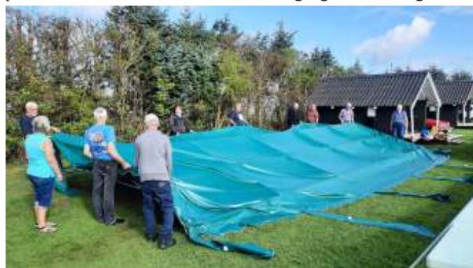
Teltet pakkes sammen.