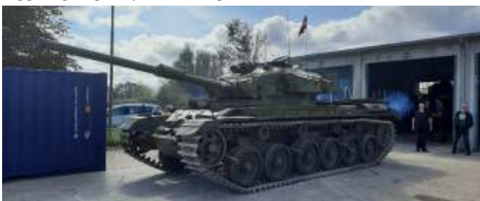
Centurion kampvognen blev startet op og kørt ud af garagen.

Vi så blandt andet en PMV, ligesom den, som Martin var reservekører på i 14 måneder fra 1969 til 1970. Herefter så vi deres Leopard og Centurion kampvogne, og Centurion kampvognen blev startet op og kørt udenfor. Der blev sat en trappe op, så vi kunne kravle op, og se den indvendigt. Det var lige noget for mændene, og der var flere der var oppe og kigge, og nogle stykker var også nede i den.