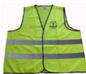
Refleksevest velcro: 100 kr