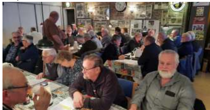
Folk var mødt tidligt op. Allerede 10 minutter i syv var der næsten fuldt hus.