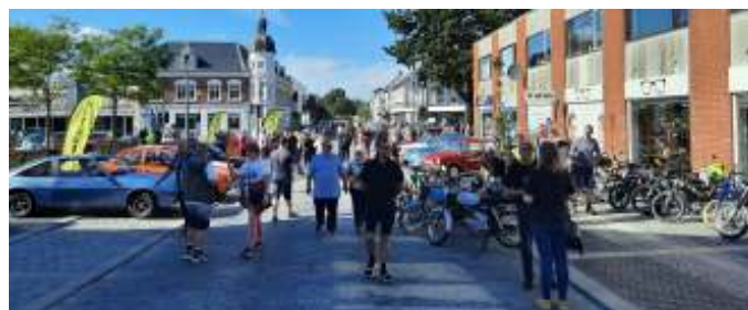
Masser af mennesker i Farsø til "Hot summer".

Så kom sommeren, og selvom det havde regnet i løbet af dagen, så var der godt vejr og høj solskin til "Hot Summer" i Farsø. Aalestrup Classic var igen i år inviteret til at komme og udstille vores køretøjer, og det var der rigtig mange, der benyttede sig af. Fra omkring kl. 16.30 begyndte de forskellige køretøjer at møde op og parkere i midtbyen, som var spærret af til formålet. Der var som sædvanlig stort fremmøde, så det endte med ca. 75 biler, en masse motorcykler og knallerter, samt en masse mennesker.