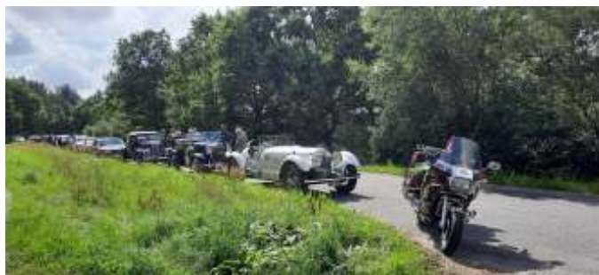
Pause ved Madum Sø.