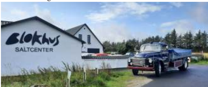
Parkering ved Blokhus Saltcenter.

Vi startede fra campingpladsen kl. 10, og kørte mod Saltum, drejede fra ved Saltum kirke, og videre ad vejen mod Fårup Sommerland og ud til Blokhus Saltcenter.