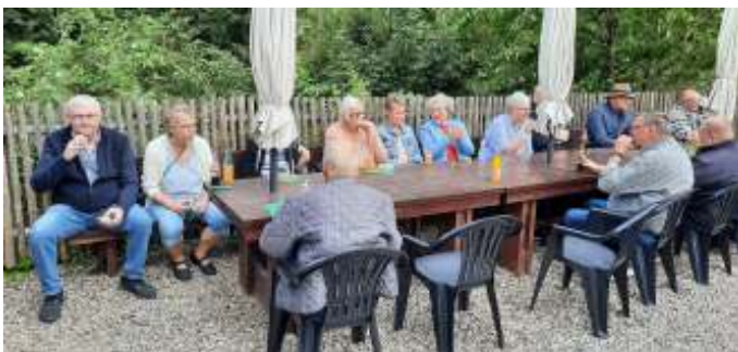
Inden køreturen var der sandwich og sodavand til alle.