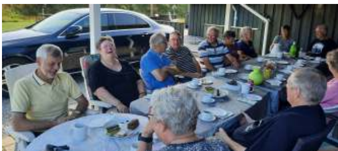
Kaffe og kage i carporten ved sommerhuset.

Vi var 16 personer fordelt på 4 hold til at spille Krolf. Holdene blev fordelt tilfældigt, ved at vi alle skulle trække et kort, og dem der havde fået ens kort, var på hold sammen. Det var ligesom tidligere år sjovt, og der blev grinet og hygget meget under spillet. Da vi var færdig med turneringen fik vi kaffe, kage og slik i carporten ved sommerhuset. Der var høj solskin denne dag, så derfor var der ikke dækket op på terrassen, men i stedet i carporten, så vi kunne få lidt skygge.