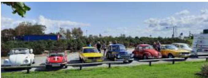
Vi mødtes til frokost ved Aggersundbroen.

Vi var 8 biler og 12 personer, som mødtes, ganske som vi plejer, ved Aggersundbroen, for at spise vores frokost. Der var fint vejr, solskin med lidt blæst.