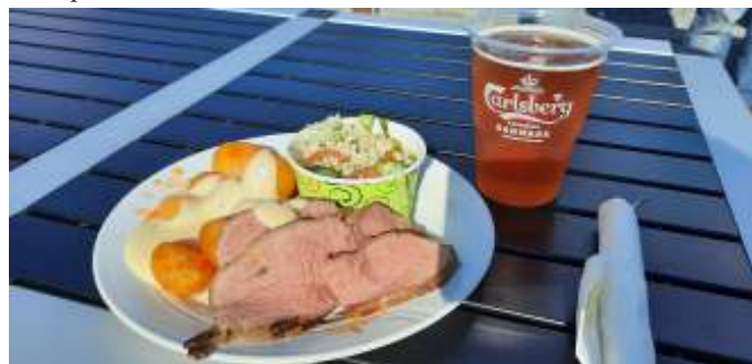
Maden fra Farsø Hotel var virkelig lækker.

Når man havde parkeret sit køretøj, skulle man hen til Lene og have sin madbillet, og der var flere retter at vælge imellem. Farsø Hotel serverede rosastegt oksefilet med kartofler og bearnaisesauce samt salat. Det lille slagteri serverede helstegt gris med flødekartofler, og Event og Gastronomi serverede biker burger med pommes frites. Der var opstillet borde og bænke flere steder, men med alle de mennesker, der også var kommet for at kigge på køretøjerne, så var der hurtig fyldt op. Så var det godt, at man i bilen har bord og stole med, så man altid har en siddeplads.