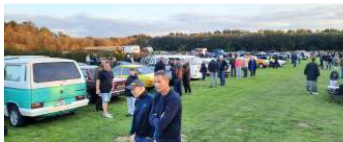
Et lille kig ud over pladsen.

Efter vi havde spist kørte vi til et stort biltræf i Brønderslev. Der var utrolig mange køretøjer og mennesker, og det var spændende at se en masse køretøjer, som vi ikke plejer at se på de træf, vi normalt tager til. Vi fik senere at vide, at der havde været omkring 580 køretøjer den aften. To uger efter var der omkring 900 køretøjer, og de måtte afvise omkring 300 køretøjer, fordi der simpelthen ikke var plads til dem alle.