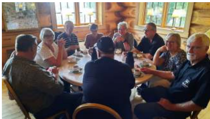
Efter køreturen var der kaffe/te og æblekage i Westernhuset.

Efter en halv times pause fortsatte turen mod Hellum, Asp, Skørping og tilbage til Rebild, hvor vi fik parkeret bilerne, inden vi gik mod Westernhuset, hvor der var dækket op til kaffe/te og æblekage.