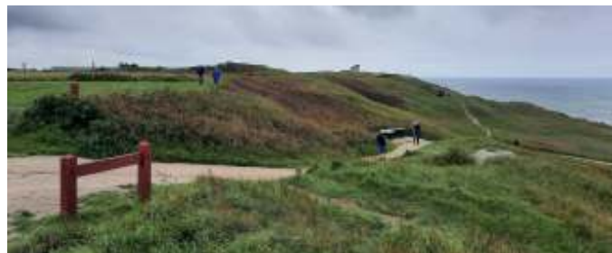
Bunkermuseet strækker sig over et stort område.

Der var meget at se på, på bunkermuseet, der strækker sig over et stort område, med mange forskellige bunkers. De var igang med at restaurere fyret, så det var desværre lukket, så man ikke kunne komme derop. Vi spiste vores medbragte mad i madpakkehuset, der er ved siden af fyret.