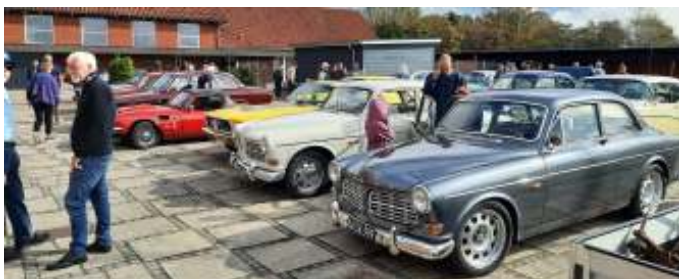
Kræmmermarked ved MVVK's klubhus.

Dagen startede med at vi mødtes til fotografering på pladsen foran campingpladsen, hvorefter vi kørte ud til MVVK (MidtVendsyssel Veteran Klub), hvor der var kræmmermarked ved deres klubhus. Vi var der ikke ret længe, da vi jo skulle tilbage til campingpladsen, hvor der var træf fra 13-16. Vi var der dog længe nok til, at vi fik set klubhuset, de biler de havde udstillet, og der var også nogle, der fik handlet lidt på kræmmermarkedet.