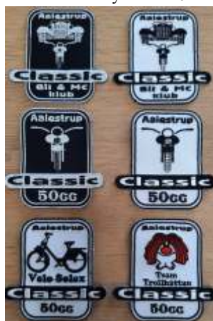
Små stofmærker (7,5 cm x 7,5 cm): 25 kr

Næste klubblad udkommer: Midt i Marts 2024