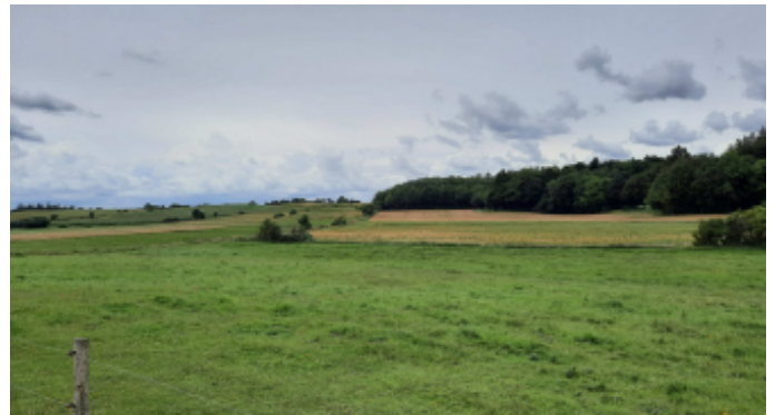
Lerkenfeldt Ådal med Holmen til højre.