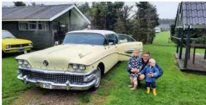
Den tyske far med børnene.