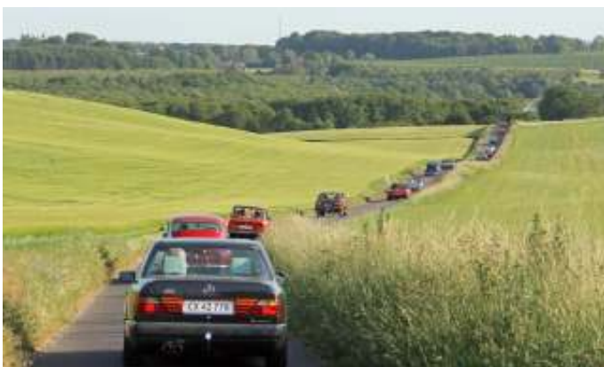
De mange biler i det smukke og kuperede terræn.

Snakken gik lystig, og der var som sædvanlig en super god stemning. Turen gik videre mod Tjele ad hårnålesving og kuperet terræn.