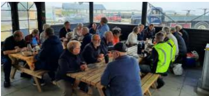
Morgenkaffe i madpakkehuset på havnen i Hvalpsund.

Vi mødtes i madpakkehuset på havnen i Hvalpsund kl. 9, med vore medbragte madpakkekurve. Vi startede med kaffe og rundstykker og snakken gik vældig, som den plejer. Der var mødt 46 personer op, og de var fordelt i 22 biler, 2 motorcykler og en enkelt lastbil.