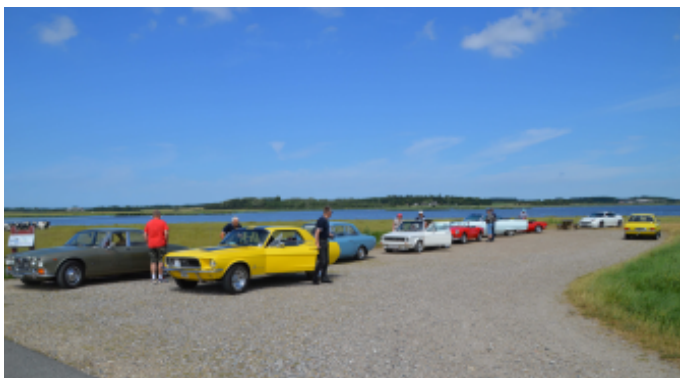
Pause ved broen på den anden side af Vilsted sø

Turen gik videre ud af vejen til Munksjørup, og ud til broen over Vilsted Sø. Her holdt vi pause, og gik en tur ud på broen.