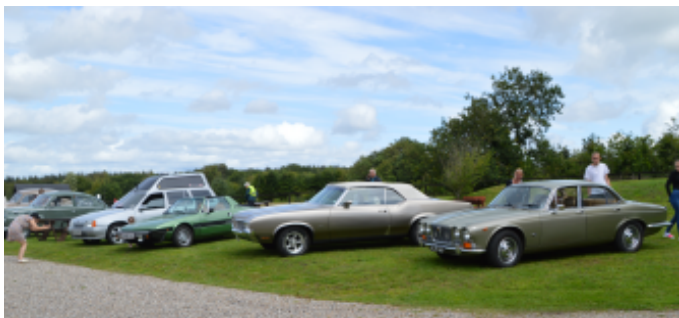
Vi var 8 biler og en lastbil til sommerlejren.

Vi var 8 biler og en lastbil, der mødtes ved madpakkehuset i Hvalpsund, og så kørte vi i kortege ud til "Over Koen", og parkerede på græsset foran huset.