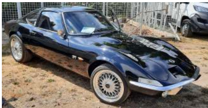
Jesper var netop hjemkommet fra Opel GT træf i Emmetal i Schweiz.