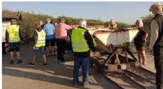
Der fortælles om kuludvinding ved Hasle.

Vi var forskånet for voldsomme uheld. Der var lidt punkteringer og tændrørsbøvl, men det meste blev klaret på stedet, eller på campingpladsen. Vi var på en rigtig dejlig tur med samme Bornholmergruppe, som for 2 år siden, og vi så nogle mega flotte steder. Vi så blandt andet kuludvinding ved Hasle og Rønne granitbrud.