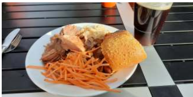
Lækkert grillgris med tilbehør.

Klokken lidt i seks blev der åbnet for køb af aftensmad, og der gik ikke mange minutter, før der var lang kø. De var dog ret kvikke til at ekspedere, så det tog ikke lang tid at komme gennem køen. 1 person i hvert køretøj kunne spise gratis, og resten kunne købe mad, hvor overskudet gik til at drive købmandsgården. Menuen var helstegt pattegris med tilbehør.