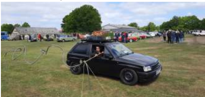
Deltagere i "Rør konkurrencen".

Ved middagstid var der lidt underholdning, hvor man kunne deltage i en konkurrence med at køre langs et bukket rør, med en ketsjer i hånden, og så skulle man undgå at ketsjeren rørte røret, for så ville der være et horn, der båttede. Der var desværre ikke den store tilslutning til denne konkurrence.