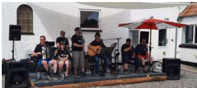
"BV2 Band" spillede to gange i løbet af eftermiddagen.

To gange i løbet af eftermiddagen spillede bandet "BV2 Band", som har vundet Handicap Grand Prix i 2022. De spillede flere 80er og 90er numre, og var faktisk ret gode.