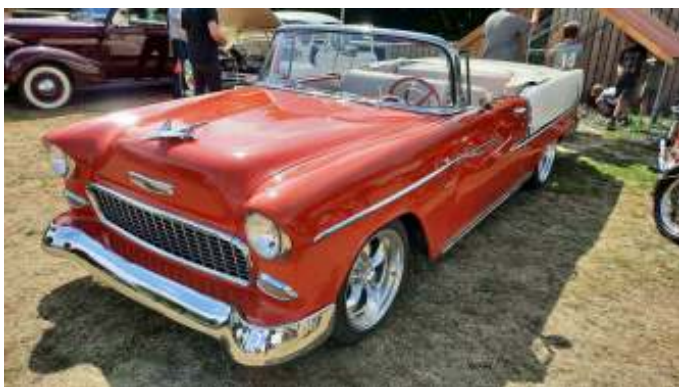
En rigtig fin Chevrolet BelAir fra 1955.

To gange i løbet af eftermiddagen spillede bandet "BV2 Band", som har vundet Handicap Grand Prix i 2022. De spillede flere 80er og 90er numre, og var faktisk ret gode.