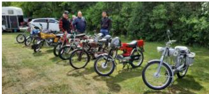
Et lille udsnit af nogle af de mange knallerter til træffet.

Lidt senere var der også arrangeret knallertringridning. Jeg var optaget af andre ting mens det stod på, så jeg fik ikke taget billeder af konkurrencen, men har fået at vide, at der heldigvis var meget større tilslutning til deltagelsen i denne konkurrence. Vi tænker, at det bliver en tilbagevendende begivenhed.