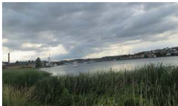
Udsigt ind mod Hobro på vej retur fra skoven.