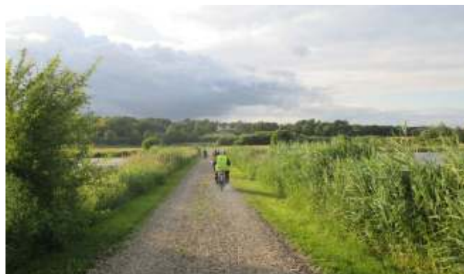
Rigtig flot udsigt når man forlader Fyrkat af grusvejen.