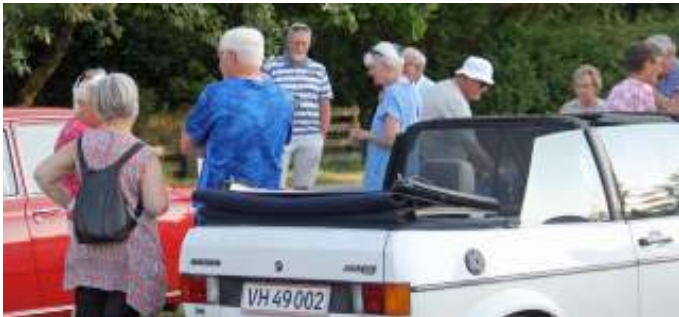
Pause ved Bigumsøbad.