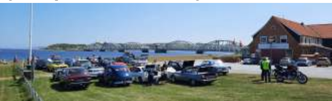
Middagspause ved Hotel Vilsund Strand.

Derfra kørte vi mod Sallingsundbroen, og så var vi på Mors. Vi kørte stødt og roligt mod Øster Jølby og Vildsund. Da broen var passeret holdt vi til højre, og drejede ned bag ved Hotel Vildsund Strand, hvor vi fandt et egnet græsareal, hvor vi parkerede. Nu var vi alle også blevet godt sultne og tørstige. Borde, stole og køletasker/picnickurve, blev taget ud af bilerne, og stillet op, hvor vi havde en fin udsigt ned over broen.