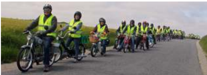
De 59 knallerter fyldte en del på de små veje på Salling.

Turen gik så tæt på vandet, som det vidst var muligt, ad små veje til Branden havn, hvor vi holdt pause ved fæргеlejet, hvor færgen til Fur lægger til.