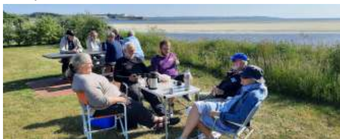
Eftermiddagskaffe ved Aggersundbroen.

Senere bevægede vi os hjemover mod Ræhr, Hjørdemål og Vesløs, for at gøre holdt ude på Vejleren, hvor der er et danmarks største fuglereservater, så her var der rig mulighed for at opleve naturen. Nu var flere af os ved at snakke om eftermiddagskaffe, og vi fik at vide, at den skulle vi have ved Aggersundbroen. Så gik det mod Fjeritslev, for lidt senere at gøre holdt lige før broen i Aggersund, hvor der er opstillet en del borde/bænksæt. Så alle fik en siddeplads, og forhåbentlig tørt madkurven for kage og kaffe. Man skulle jo nødig slæbe noget med hjem.