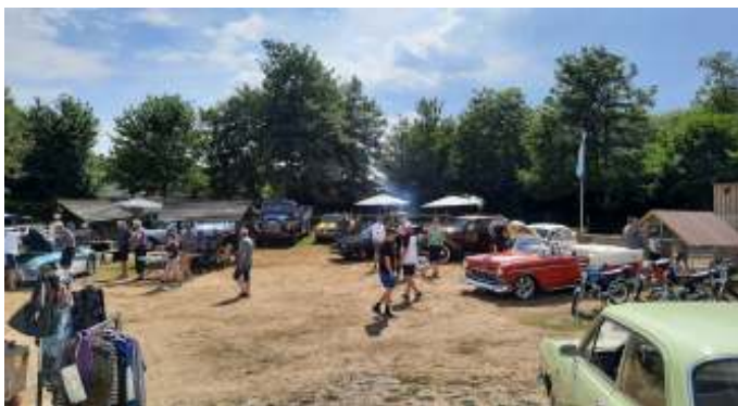
Klokken kvart over tre var der allerede godt fyldt op i gården.

Vi ankom omkring kl 14:30, og der var der allerede flere biler på pladsen, og i løbet af en halv time begyndte det for alvor at strømme til. Jeg var ikke rundt og tælle, men jeg vil gætte på at de nåede op på ca. 30 biler, et par motorcykler og omkring 10 knallerter.