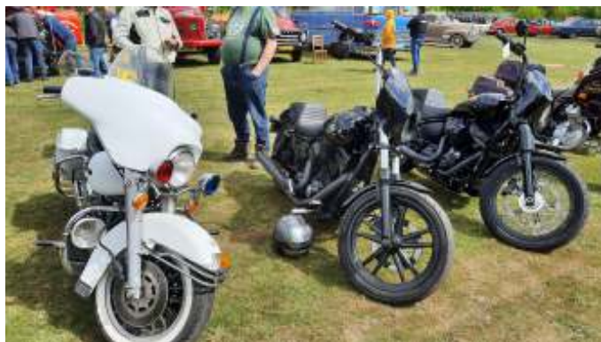
Vinder af bedste MC - Harley Davidson politomotorcykel.

Omkring klokken 14:30 var der uddeling af præmier til vinderne i de 3 kategorier, samt til vinderne af "rør konkurrencen" og knallertringridning, samt udtrækning af præmier blandt deltagerne. Herefter begyndte folk så småt at køre hjem, og vi gik i gang med oprydningen, og nedtagning af teltet. Dette var vi færdige med omkring kl 17.