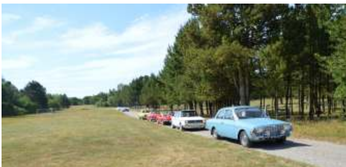
Opsamling i sommerhusområdet ved Hvalpsund.

Selve køreturen startede ved 10 tiden. Der var 9 biler og 18 personer på køreturen, som gik over Hvam, Kallestrup, Tostrup og derefter mod Fjelsø. Vi kørte en tur rundt om søen, og ud af Præstevejen, mod Gedsted. Derefter igennem Gedsted by og ud af Våsen til Ullits. Fin grusvej at køre på. Turen gik videre mod Alstrup og forbi kirken, videre mod Louns og ud igennem sommerhusområdet til Hessel, hvor vi gjorde et lille stop og nød udsigten til Hvalpsundfærgen.