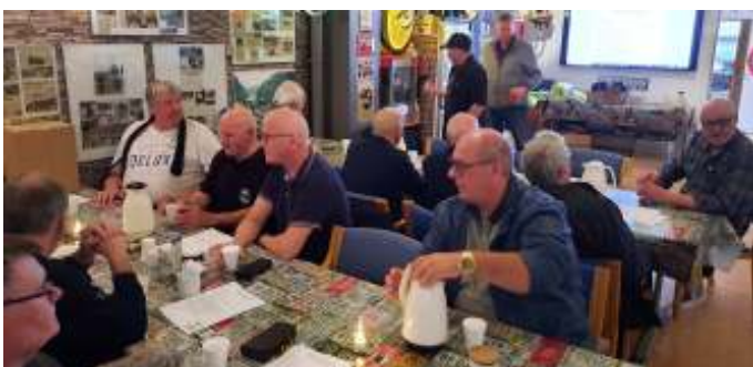
Der plejer at være et fint fremmøde til generalforsamlingen.