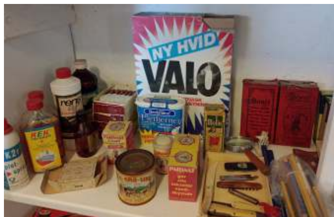
Fra Bornholms tekniske museum - Vi mindes vores barn- og ungdom.