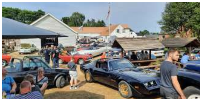
Klokken halv fem var der helt fyldt op i gården.

Klokken lidt i seks blev der åbnet for køb af aftensmad, og der gik ikke mange minutter, før der var lang kø. De var dog ret kvikke til at ekspedere, så det tog ikke lang tid at komme gennem køen. 1 person i hvert køretøj kunne spise gratis, og resten kunne købe mad, hvor overskudet gik til at drive købmandsgården. Menuen var helstegt pattegris med tilbehør.