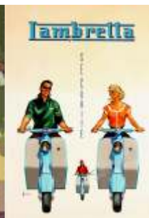
Et par gamle reklamer for scootere.

Det bliver først til foråret, at vi rigtig kommer ud og køre, men vi vil i løbet af efteråret eller vinteren, præsentere vores nye afdeling til en klubaften i klubhuset. Til stumpemarked i Aars den 30. September vil I også kunne møde Aalestrup Classic Scooter og nogle spændende scootere.