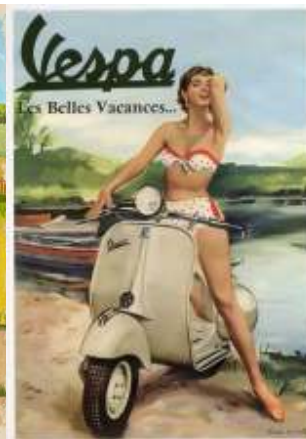
Et par gamle reklamer for scootere.

Vi ser desværre aldrig scootere i Aalestrup Classic Bil & MC klub, men det vil vi nu lave om på, med vores nye afdeling: Aalestrup Classic Scooter