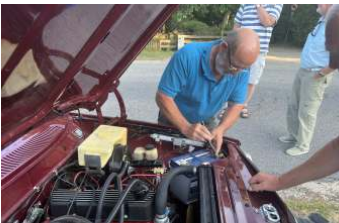
Torben måtte lige have efterspændt polskoen på batteriet.