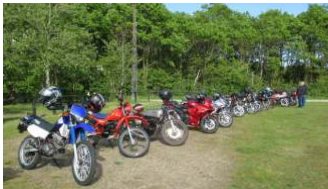
Hele 18 motorcykler (og deres ejere) var mødt op til denne køretur.