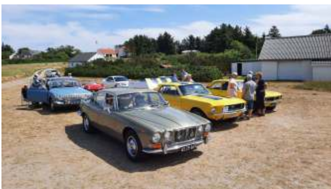
Pause ved Ertebølle.

Derfra til Hvalpsund, hvor vi måtte have et lille uplanlagt stop, da nogen "glemte" at holde øje med dem bagved, og derfor var der nogen, der kørte forkert, da de ikke kunne se dem foran. Derefter ud af Hestbækvej, over Løgstørvej mod Fandrup og ud over Risgårde mod Strandby og Ertebølle, hvor vi gjorde et stop og holdt en pause, hvor man kunne gå op og nyde udsigten ud over vandet.