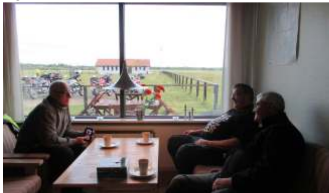
Kaffe i klubhuset på flyvepladsen efter køreturen.