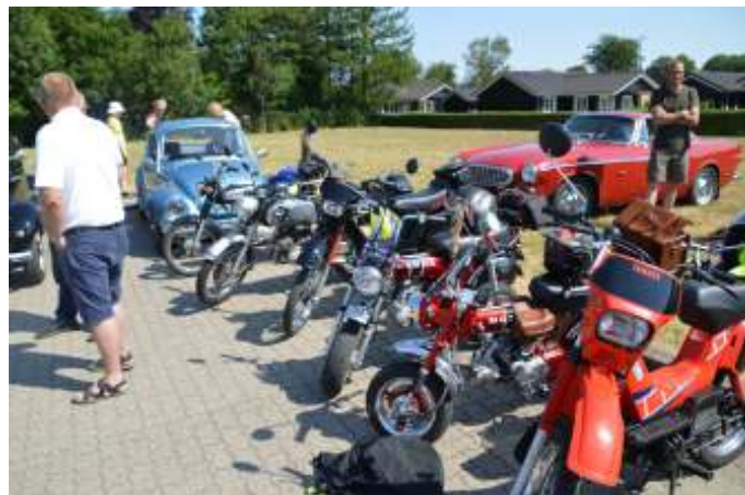
Knallertfolket var også pænt repræsenteret til træffet.