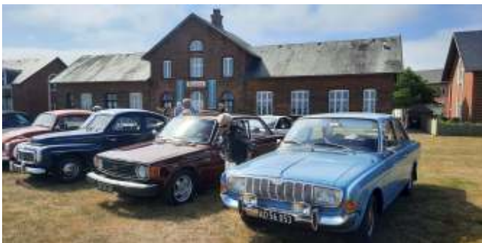
Pause ved lystbådehavnen i Glyngøre.

Kl.10:00 skulle vi med færgen "Mary", på den anden side af fjorden til Sundsøre. Derfra kørte vi mod Thise, Grætrup, Junget, Batum og gjorde stop i Glyngøre, ved lystbådehavn og museum/kulturstationen. Der fik vi sparket lidt dæk, byttet lidt løgn, samt foretaget toiletbesøg.