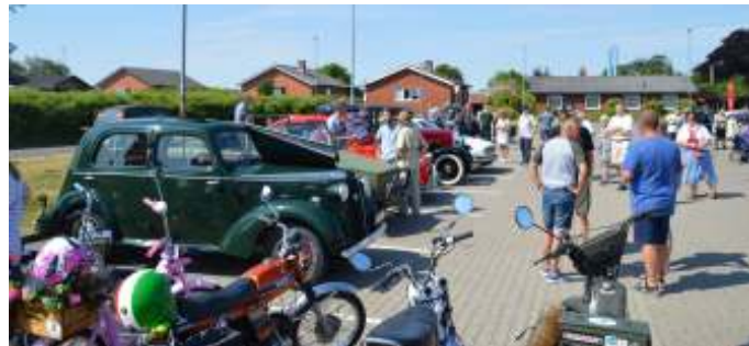
Træffet var godt besøgt af både udstillere og gæster.

Daglig Brugsen i Hornum har været vært ved et lidt larmende arrangement, for igen i år var Aalestrup Classic Bil & MC Klub inviteret til at komme og vise vores køretøjer frem. Lige netop denne lørdag skinnede solen fra en næsten skyfri himmel, og der var 30 grader i solen, så der var mange, der havde taget imod tilbuddet om at komme.