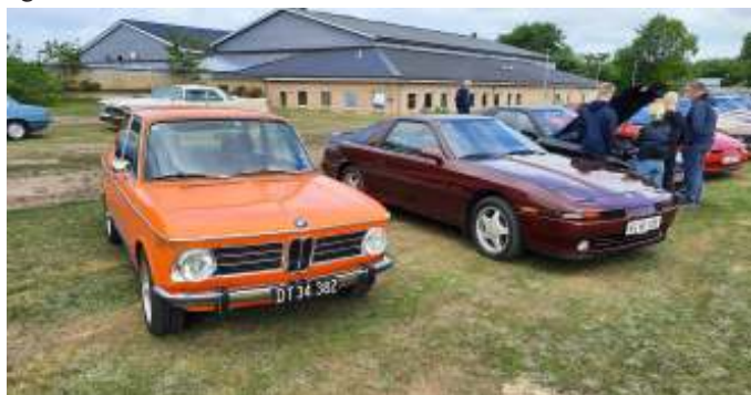
Vinder af bedste bil - BMW 2002 fra 1972.