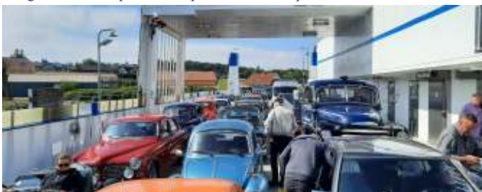
Der var godt fyldt op ombord på "Mary".

Kl.10:00 skulle vi med færgen "Mary", på den anden side af fjorden til Sundsøre. Derfra kørte vi mod Thise, Grætrup, Junget, Batum og gjorde stop i Glyngøre, ved lystbådehavn og museum/kulturstationen. Der fik vi sparket lidt dæk, byttet lidt løgn, samt foretaget toiletbesøg.