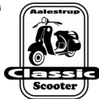
Aalestrup Classic Scooter logo.

Vi ser desværre aldrig scootere i Aalestrup Classic Bil & MC klub, men det vil vi nu lave om på, med vores nye afdeling: Aalestrup Classic Scooter