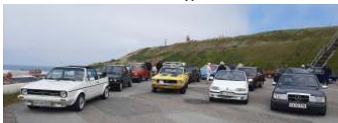
Pause i Hanstholm.

Da vi havde set, hvad vi ville, steg vi ind i bilerne og rullede opad mod Vorupør, hvor vi lige vendte en omgang. Næste station var Klitmøller, så vi kørte et lille stykke længere mod nord. Der var heldigvis så mange p-pladser, at vi kunne holde samlet nede ved surferstranden. Der var en del turister der, men det er jo nok normalt på denne årstid. Nogle havde fået lyst til en is, andre var blevet lidt lækkersultne. Dæksparket var ikke helt overstået endnu, så det nåede vi også lidt af. Der blev også tid til et toiletbesøg (vi var jo en del pensionister). Hanstholm skulle også lige have et besøg. Vi kørte gennem byen, og op på den høje bakketop, hvor vi alle kunne parkere samlet. Her er der en fantastisk udsigt ned over byen, havnen og havet. Der var jo høj solskin, så det var et fint sted at stoppe.