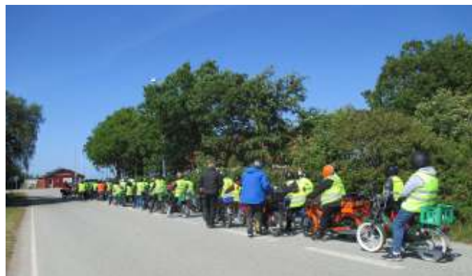
Klar til at køre ombord på "Mary" i Sundsøre.

Fra Lyby var der kun turen tilbage til Sundsøre og sejlturen retur til Hvalpsund.