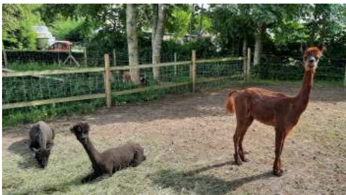
Alpacaerne var lige blevet klippet.

Fredag den 16. Juni 2023 var vi inviteret til sommermarked ved Gundersted Købmandsgård. Gundersted Købmandsgård er et beskæftigelsestilbud til fysisk og psykisk udfordrede voksne i Vesthimmerlands Kommune. Købmandsgården drives som et samarbejde mellem Globen Vesthimmerland, Min Købmand i Farstrup og foreningen Gundersted Købmandsgård. Den danner i dag dagligt ramme for ca. 16 brugere, der udover at beskæftige sig med butikdrift også tilbydes arbejde på et vedligeholdelsesværksted, job på et skovhold, der laver brænde og plads i en pedelgruppe, der servicerer lokale haveholdere i Gundersted, Aars og Løgstør. Målet for aktiviteterne er at skabe meningsfyldt beskæftigelse til de daglige brugere af stedet. Købmandsgården har også nogle geder og nogle alpacaer, som stedets brugere passer.