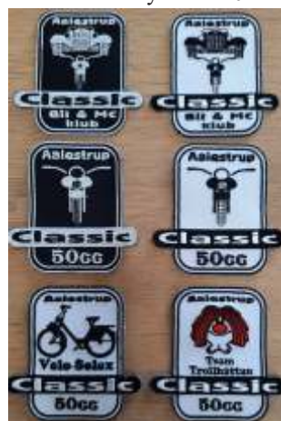
Små stofmærker (7,5 cm x 7,5 cm): 25 kr