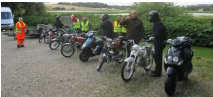
Pause ved Fyrkat.