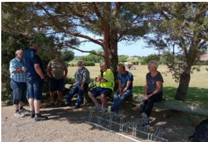
En lille pause i skyggen.

"Ordnung muss sein", som de siger i Tyskland. Vi var rundt på øen, nogle gange hele flokken, og nogen gange kørte vi i mindre grupper, så det var meget afslappet, og jeg havde indtryk af, at alle fik en god ferie.