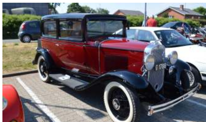
En rigtig fin Chevrolet Xbae fra 1931.

Der var 15 biler, 10 motorcykler og 17 knallerter, der havde fundet vej til Brugsen, så der var noget at kigge på, for de mange interesserede. I dagens anledning inviterede Brugsen på gratis pølser, og en øl eller sodavand til alle. Hvis man skulle have flere drikkevarer, skulle man raffle om dem. Det vil sige, at slog man en 1'er kostede den 1 kr, og slog man en 6'er kostede den 6 kr. Der var også et lykkehjul, som børnene kunne dreje, og måske vinde en gevinst. Det var et par sjove indslag fra Brugsen's side, og ellers kunne man gå ind i butikken, og gøre en god handel.