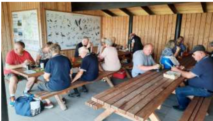
Middagspause i madpakkehuset ved Vilsted sø.

Turen gik videre ud af vejen til Munksjørup, og ud til broen over Vilsted Sø. Her holdt vi pause, og gik en tur ud på broen.