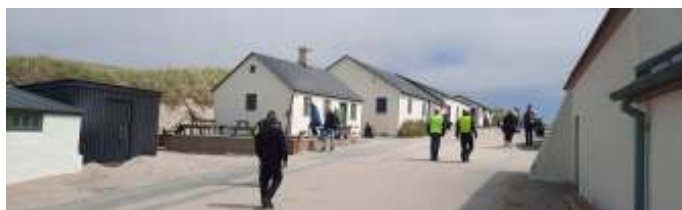
Fiskerhusene i Stenbjerg fiskerleje.

Der fik vi parkeret vore prægtige automobiler, og gik ned mod stranden. Her beundrede vi de flotte gamle fiskerhuse, og gik videre mod vandet, for at kikke på de såkaldte "Bananbåde", som er små fiskerbåde, som der var nogle stykker af. Der blæste en god vind fra vest dernede.