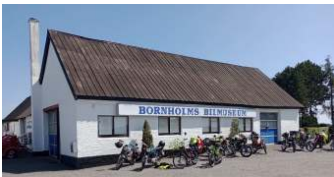
Bornholms bilmuseum blev også besøgt.

Vi tøser kunne læne os tilbage og nyde maden, og få en bette skvis i glasset. Som altid så hjalp alle til på kryds og tværs.