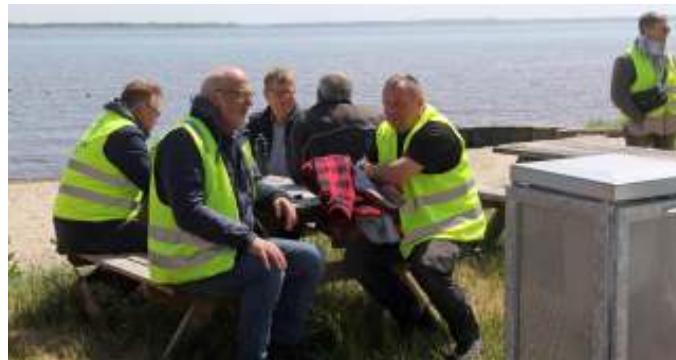
Pause ved Lyby Strand.