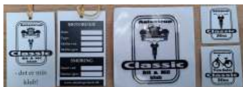
Smøresedler: Kan hentes gratis i klubben. Klistermærker: 5 kr