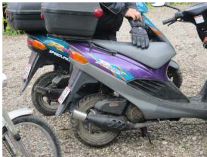
Fremtidens klassiske knallerter.