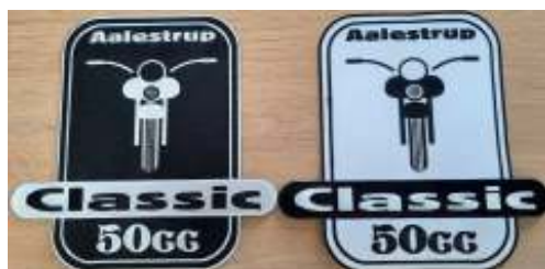
Store stofmærker (20,0 cm x 20,5 cm): 50 kr