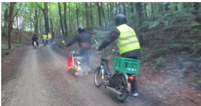
Dejlig lille bakke i skoven.