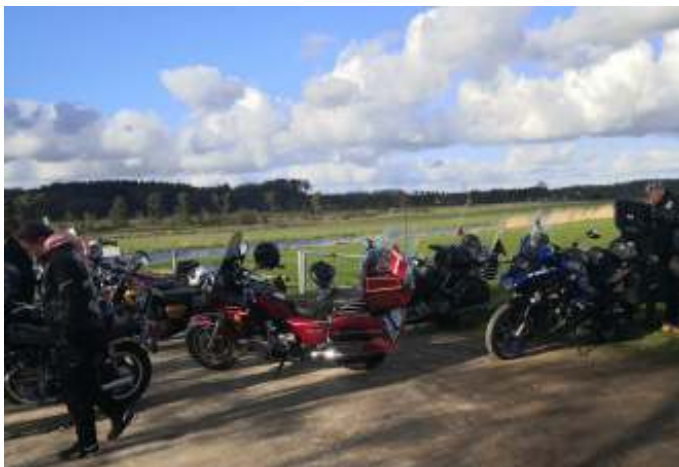
Pause ved Gudenåen i Ulstrup.